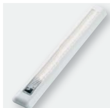
LED-Leuchte 24 Power-LEDs, 8 Watt mit Ein-/Ausschalter Art. Nr. 104904