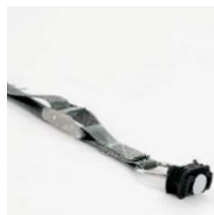
Spanngurt mit Klemmschloss, 1 m Art. Nr. 100982 mit Klemmschloss, 2 m Art. Nr. 100983