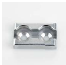
Zurrpunkt Aluminium, eloxiert Art. Nr. 106153