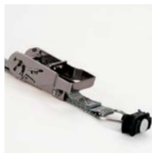
Zurrgurt mit Ratsche, 1 m Art. Nr. 100979 mit Ratsche, 2 m Art. Nr. 100980