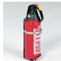
Feuerlöscher 2 kg inkl. Halterung ABC-Löschpulver Art. Nr. 100912

Weiteres Zubehör finden Sie in unserem Hauptkatalog oder unter www.aluca.de