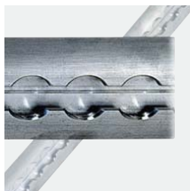
Zurrschiene Aluminium, 990 mm, Art. Nr. 100963 Aluminium, 1490 mm, Art. Nr. 100964