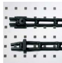
Leitergummi 30 mm breit, mit 2 Einhängeknöpfen, 1 m Art. Nr. 100985